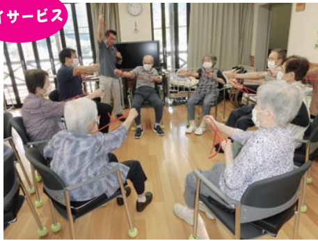
みんなで筋力アップ