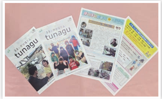
おおい町社協広報誌

ご協力いただいた皆さまに対し、心から厚くお礼を申し上げますとともに今後ともより一層のご支援、ご協力をお願い申し上げます。