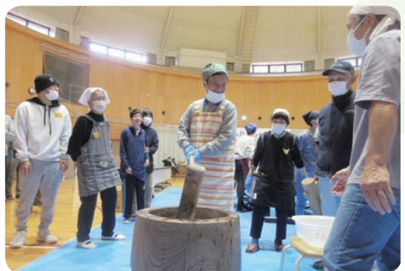
あすなる会もちつき大会