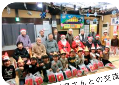
園児さんとの交流

お年寄りから子供まで地域の皆さまとの交流を目的に毎年「かんよもん祭」を開催したり、地域の交流の場としてかんよもんを利用して頂く機会づくりに「かんよもんサロン」を実施、そのほか山田地区の活動や地域行事への参加も行っています。