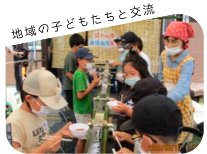
地域の子どもたちと交流