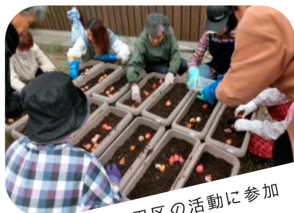
山田区の活動に参加