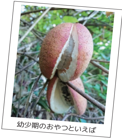
幼少期のおやつといえば