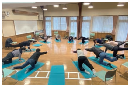
体幹トレーニング