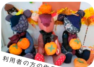
利用者の方の作品