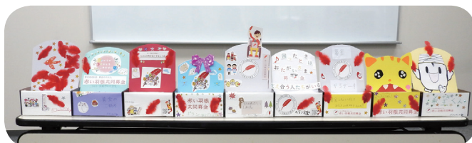
ボランティア塾生手作り募金箱