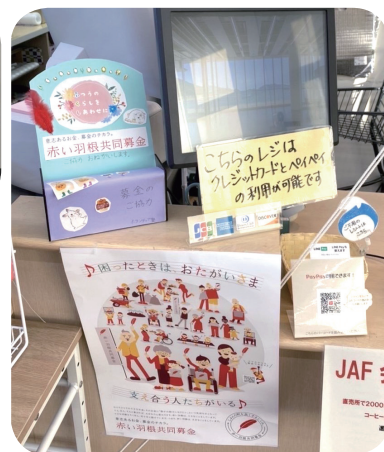
道の駅うみんぴあ大飯