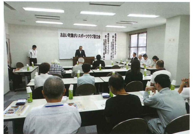
おい町障がいスポーツクラブ