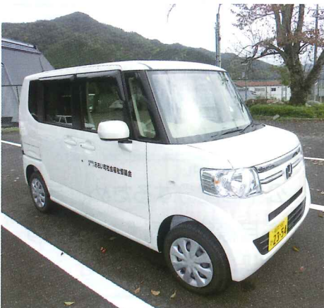
貸出福祉車両の整備