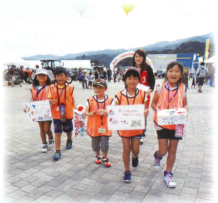
10月1日にうみんぴあフェスタでボランティア塾生による街頭募金を行いました。