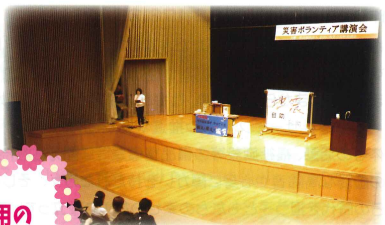
災害ボランティア講演会