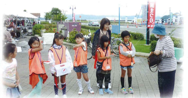
10月1日にうみんぴあフェスタでボランティア塾生による街頭募金を行いました。