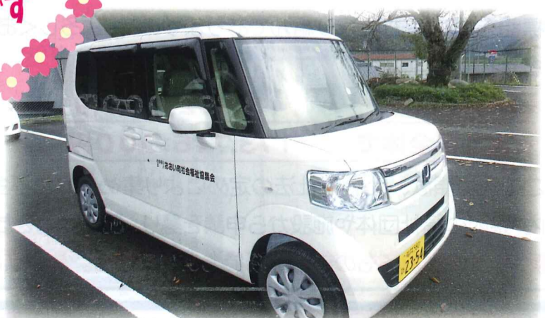
貸出福祉車両の整備