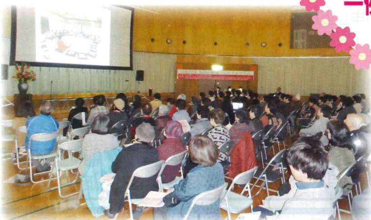
福祉の地域づくりフォーラム