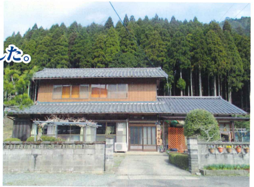
社協基本財産に登記 (土地 372.47㎡) (建物 170.26㎡)

平成21年11月に安川区に開設した小規模多機能ホーム「やすらぎ」は、元住人の(故 白谷千里氏)及び、ご親族である(被相続人: 故 萩原富士男氏)より「土地と建物を社会福祉事業の用途に使用してください」との意向から土地・建物を借り受け、小地域福祉活動の拠点に位置づけ、地域密着型の介護サービスを展開し、現在に至っております。