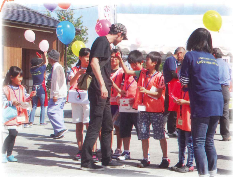
うみんぴあフェスタにて

赤い羽根共同募金・歳末たすけあい募金には皆様からあたたかい浄財をお寄せいただき、関係者一同謹んでお礼申し上げます。