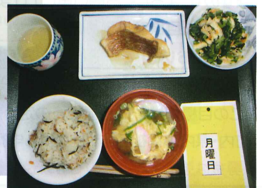
出来上がった昼食