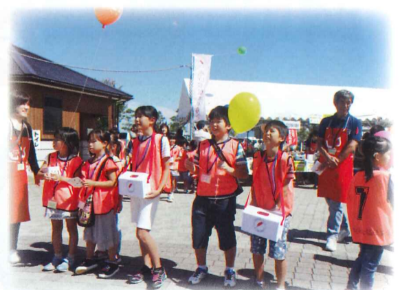
10月3日にうみんぴあフェスタでボランティア塾生による街頭募金を行いました。