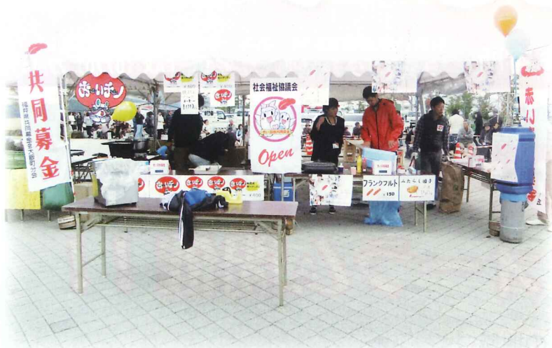
うみんぴあフェスタにて

赤い羽根共同募金・歳末たすけあい募金には皆様からあたたかい浄財をお寄せいただき、関係者一同謹んでお礼申し上げます。