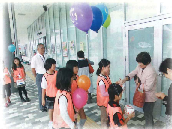
10月5日に高浜ママーズストア大飯店(上)と道の駅うみんぴあ大飯(下)でボランティア塾生による街頭募金活動を行いました。