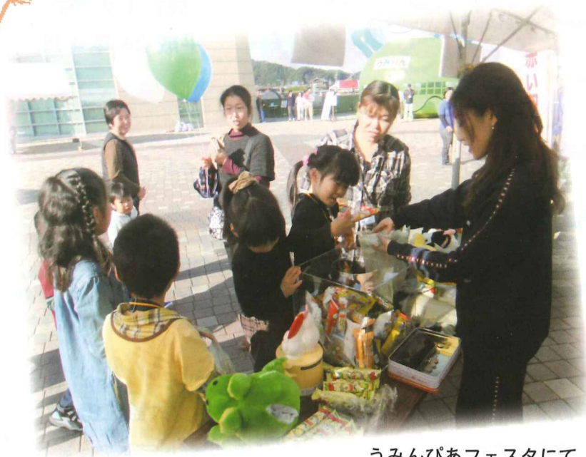
うみんぴあフェスタにて

赤い羽根共同募金・歳末たすけあい募金には皆様からあたたかい浄財をお寄せいただき、関係者一同謹んでお礼申し上げます。