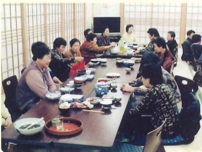
河村いきいきクラブ