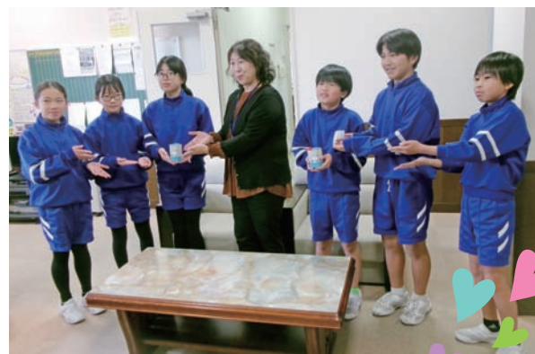
『大島小学校のみなさん』

「福祉のために使ってください」との意思を受け取り、おおい町の福祉発展のため大切にに使わせていただきます。ご協力いただいた皆さん本当にありがとうございました。