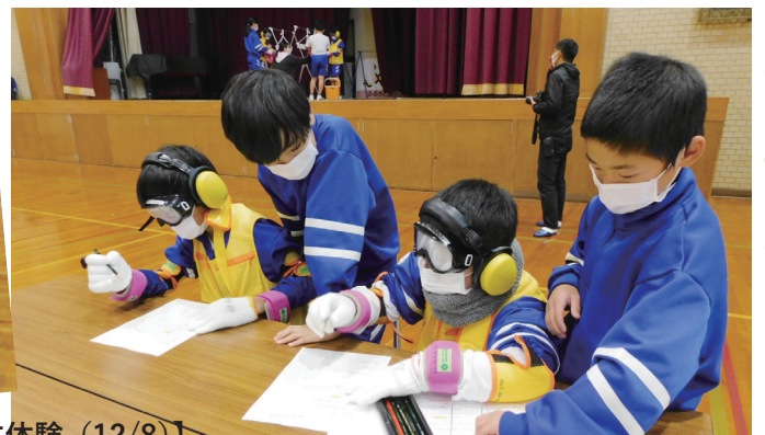
【大島小学校 5年生、6年生：シニア体験、車いす体験 (12/8)】