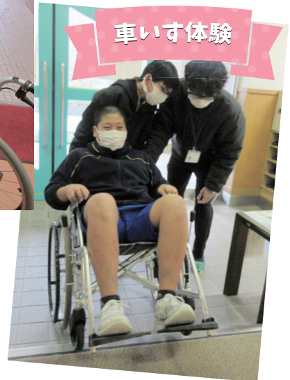
【佐分利小学校 6年生： 車いす体験 (12/15)】