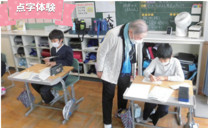
【大島小学校 4年生：点字体験 (12/5)】