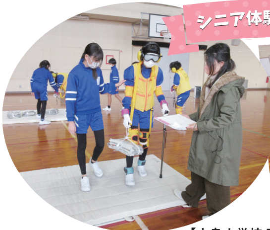
シニア体験・車いす体験